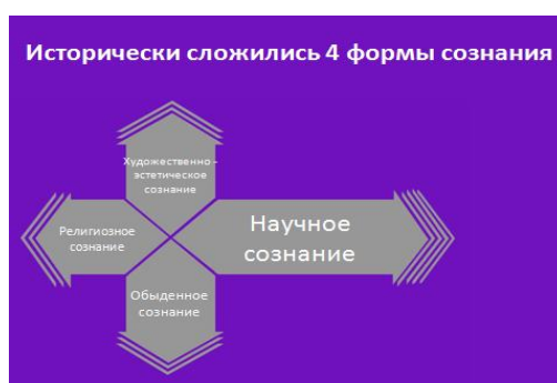
Рис. 1. 4 формы сознания в человеческом обществе

1. Сознание, качественно адекватное природе человека является естественным для него. Мы называем его природосообразным или целостным сознанием . Выбрав тот или иной предмет познания, человек, не нарушая законы природы, законы информации, законы собственного тела (мы убедимся насколько это важно!) и нейрофизиологические законы, устремлён к познанию сути.