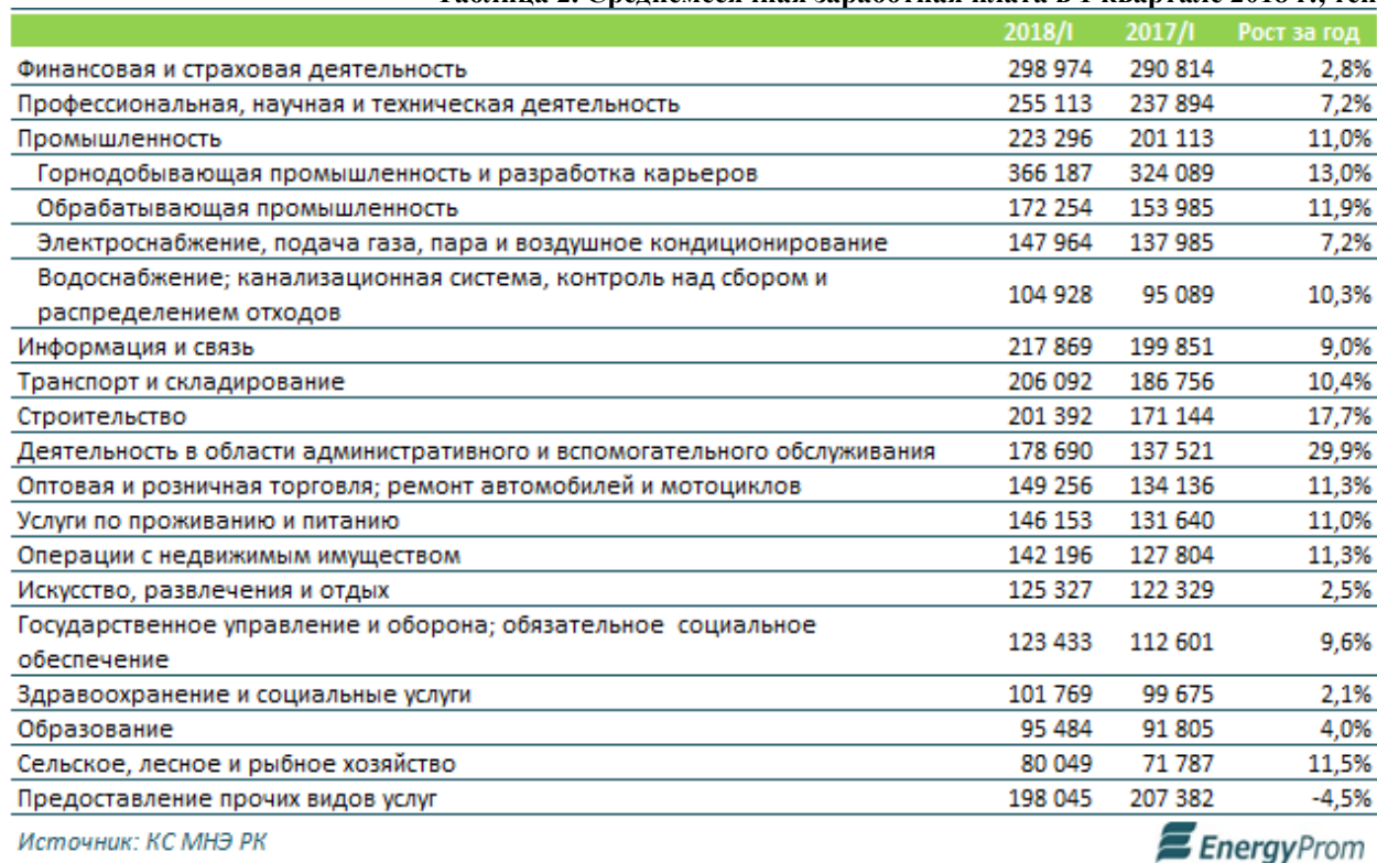
Таблица 2. Среднемесячная заработная плата в 1 квартале 2018 г., тенге

Ее размер существенно различается в зависимости от сферы деятельности. Так, в промышленности средняя зарплата составляет 75000 тенге в месяц, в строительстве – 81000 тенге, в сельском хозяйстве – 32000 тенге.