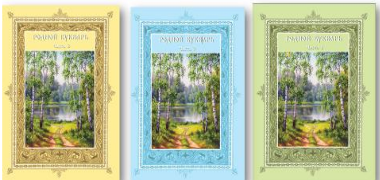
Рис. 2. Биоадекватный учебник «Родной букварь» для 1 класса. Авторы: Н.В. Антоненко, Т.М. Клименкова, М.В. Ульянова, 2013 г.

задач. Только посредством целостного мышления возможно овладение ноосферным сознанием, т.е. новым качеством личности, которое и позволит решать множество стратегически важных задач.