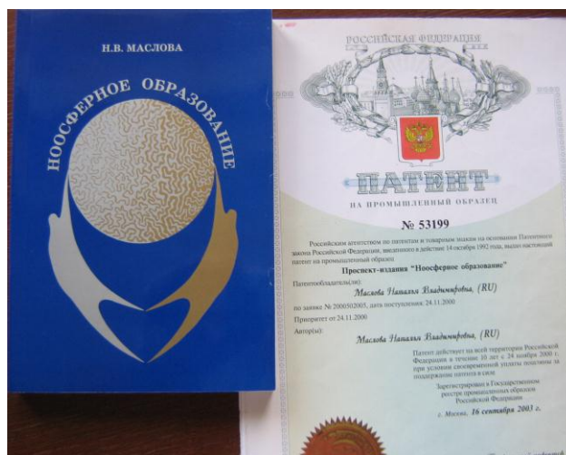
Рис. 1. Монография «Ноосферное образование» 2002 г. Автор Н.В. Маслова. Патент РФ №53199, 2002 г.

человек» [2]. Люди будущего готовятся сегодня в школе и являются стратегическим ресурсом будущего.