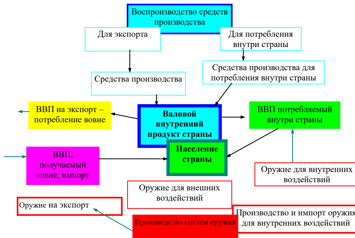
Рис. 2. Общая схема показателей, определяющих портрет страны: необходим анализ данных показателей по всем странам для определения точек сотрудничества или противодействия (конкуренции)