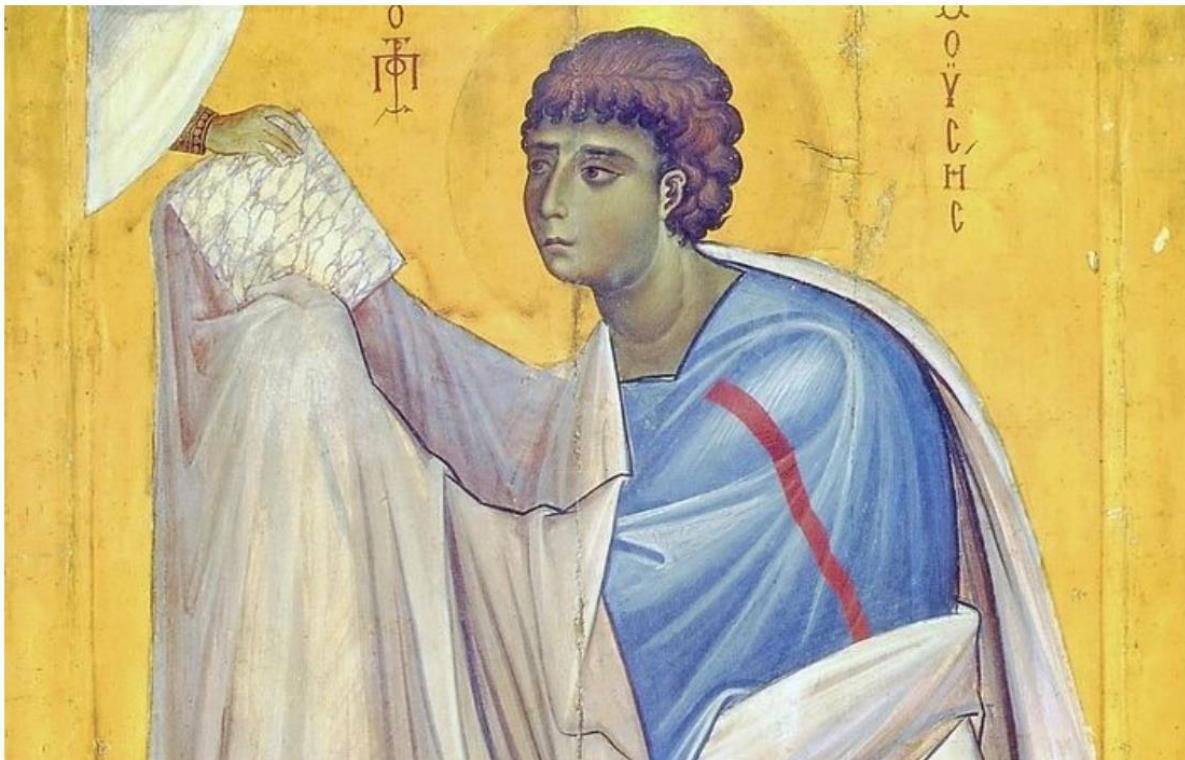
Моисей получает Скрижали Завета, Синай, монастырь Св. Екатерины

Возникает предположение, что не очень сложно и соблюдать эти 10 заповедей.